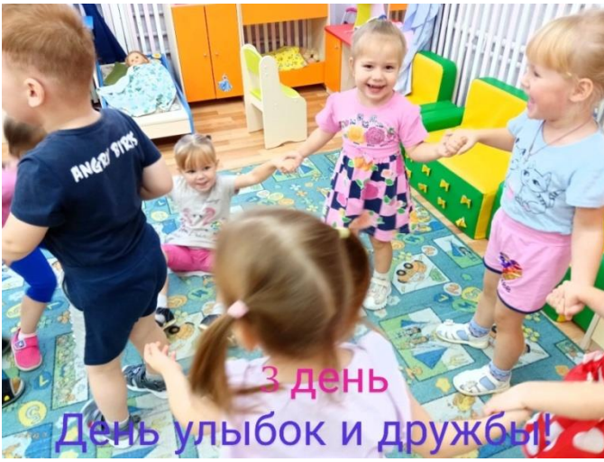
3 день День улыбок и дружбы!