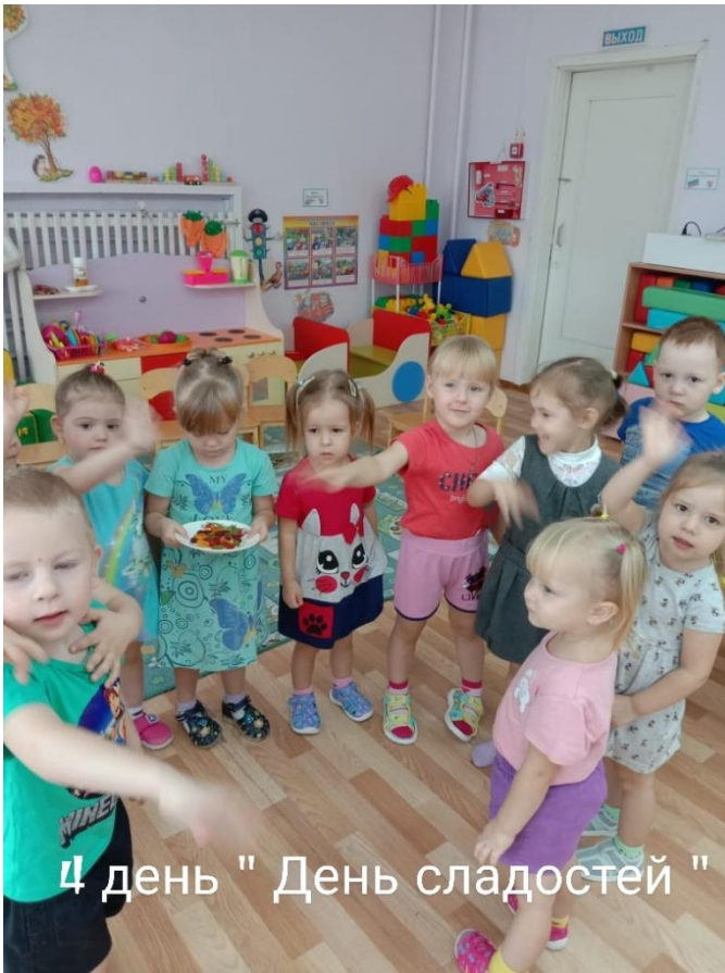
4 день " День сладостей "

Пятый день прошел под девизом : «Здесь вас любят и ждут».